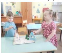
Настольный театр «Заюшкина избушка»

Для работы с детьми по данному направлению разработаны лексические темы на каждую неделю, с использованием художественной литературы.