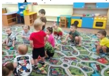
«Зайка беленький сидит...»